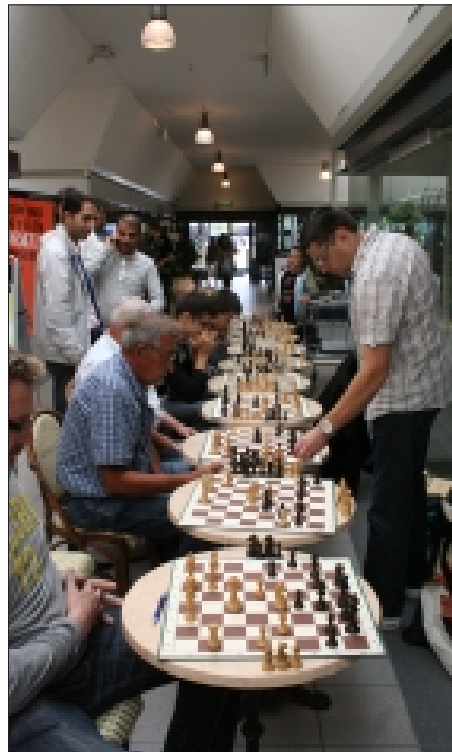
Mødet med mange modstandere

flot parti, hvor hun i en relativ kompliceret åbning spillede de første 12 træk stort set uden fejl. Desværre fik vi ikke navnet på pigen, men ingen tvivl om at der går et stort skaktalent rundt i Hvidovre. Pigen blev meget glad, da hun fik overrakt en stor æske chokolade i præmie.