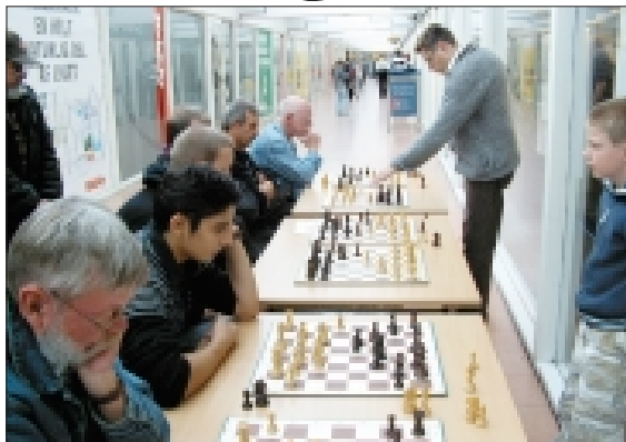
Forbipasserende, som blev fanget af udfordringen

Men Henning så dem først, og det handler det jo i høj grad om! bh