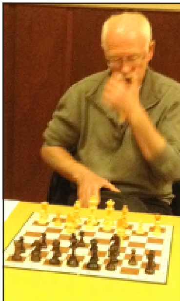
Steen tænkte store tanker – men de var ikke store nok