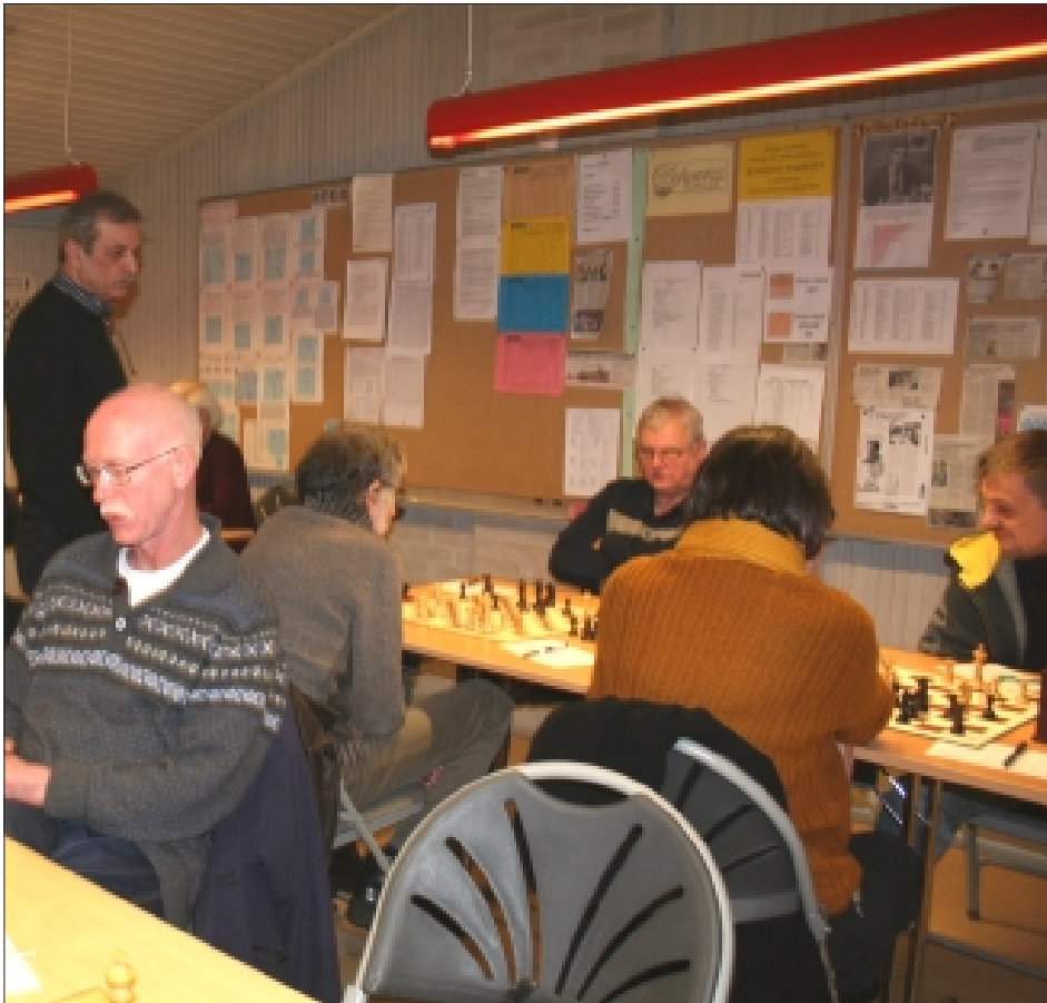
Udsnit af 2.-holdet på hjemmebane undervejs mod den hæderfulde oprykning til 2. række i KSUs Holdturnering

Medlemsblad for Hvidovre Skakklub * Nr. 2 * Maj 2013 * 62. årgang