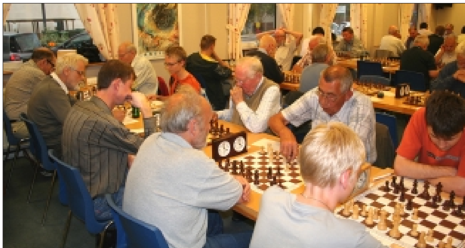
Det var her i denne ende – den nederste – der blev hente sejre på stribe