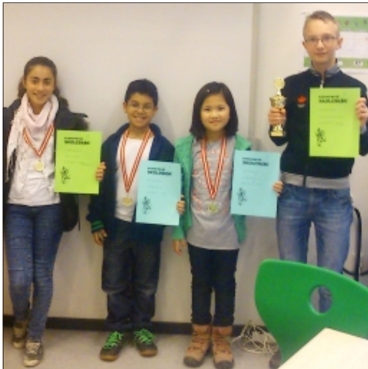
Diplomer, tre medaljer og en pokal havde fire unge skakspillere med hjem til Hvidovre fra kredsmester- skabet i skoleskak