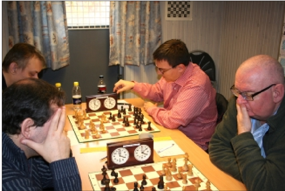
Palle (bagerst t.h.) alene – om ikke i verden så i gr. A

Så var det sidste år vi arrangerede Danske Bank EMT. Desværre udløber vores sponsorstøtte fra Danske Bank ved årets udgang, så vi skal ud og finde en ny sponsor, så vi kan fastholde det attraktive præmieniveau i vores eneste årlige turnering med deltagelse fra andre klubber.